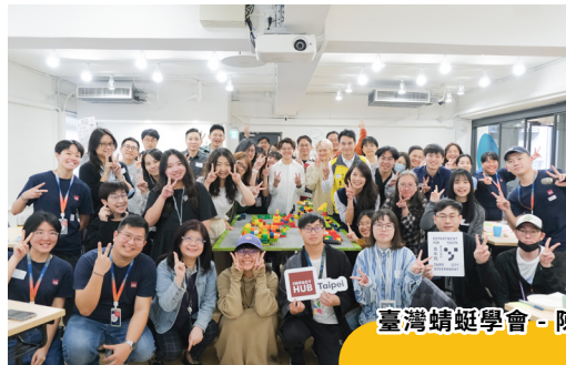
3月 Happy Hour | 聚落共識營

活動設計著重經驗分享與交流互動，透過引導式小組討論、主題分享，讓各進駐組織能快速融入聚落，也讓夥伴們持續加深彼此的連結。許多合作與創意，正是在這些輕鬆、日常的聚會中慢慢萌芽，並轉化為實際行動與合作計畫。